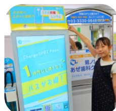
スマホ充電器レンタル「ChargeSPOT」

Q.非常事態に備え、日頃から利用者に意識してほしい事などありますか？ A.私たち駅係員や乗務員は異常時に備え、様々な訓練を行っております。非常事態が発生したときは、落ち着いて駅係員・乗務員の指示に従ってください。また、車内で非常事態が発生したときは「車内非常通報ボタン」を押して乗務員にお知らせください。