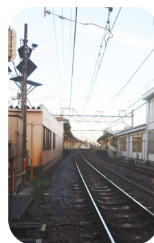
踏切から撮影した都立家政駅。駅がカーブしているのがわかります。