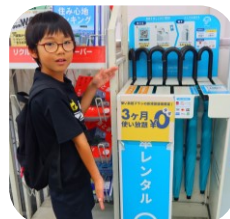
傘のシェアリングサービス レンタルスポット「アイカサ」