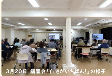
3月20日 講習会「自宅がいちばん!」の様子