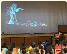
※イベントは新型コロナウイルスの蔓延防止等重点措置の適用前に開催されました。