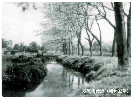
双鷺橋付近 (昭和32年)