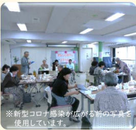
※新型コロナウイルス感染が広がる前の写真を使用しています。