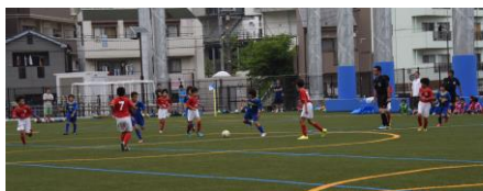
サッカーミニゲーム&試合