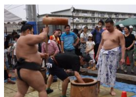
陸奥部屋の力士も参加 約千人が行列しました。