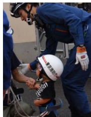
野方消防署はしご車の初お披露目