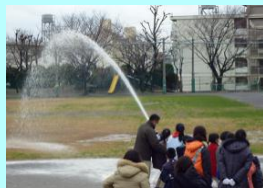
初めての放水体験

3月10日(土)若宮小学校PTA主催の「親子災害発生時対応避難訓練」が行われ、災害発生を想定した実践的な訓練を行いました。親子合わせて150人ほどの参加者が、避難マップを作りながらの参集訓練、炊き出し体験、応急救護訓練、転倒家屋からの救助・救出訓練、仮設トイレ・間仕切り設営の避難所体験、消火器・軽可搬消火ポンプによる消火訓練などを行いました。子どもたちは、真剣な表情で日ごろ経験することのない訓練に取り組んでいました。また「避難所に行かなくてもよい準備をすることが大事」ということを学びました。