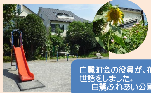
白鷺町会の役員が、花の 世話をしました。 白鷺ふれあい公園