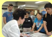
書道指導中の日高先生