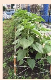
6 月中旬約 50cm