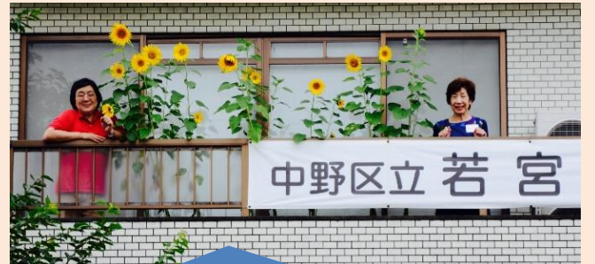
満開のひまわり！ 若宮いこいの家