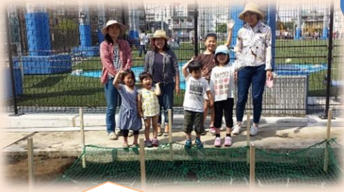
鳥よけ防止の網を張り、種まき完了！

鷺宮都営住宅の住民が、力を合わせて愛情を注ぎ大切に育てました！ ひまわりの散歩道が出来ました。種を収穫して被災地に送りたいと思ってます。 白鷺せせらぎ公園