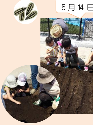
5 月 14 日種蒔き