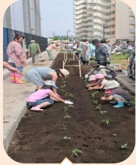
5 月 29 日苗植え