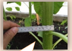
8 月上旬茎約 3cm