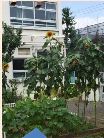
「大きくて立派」 暑い中、頑張って咲いています！ 第八中学校 中庭